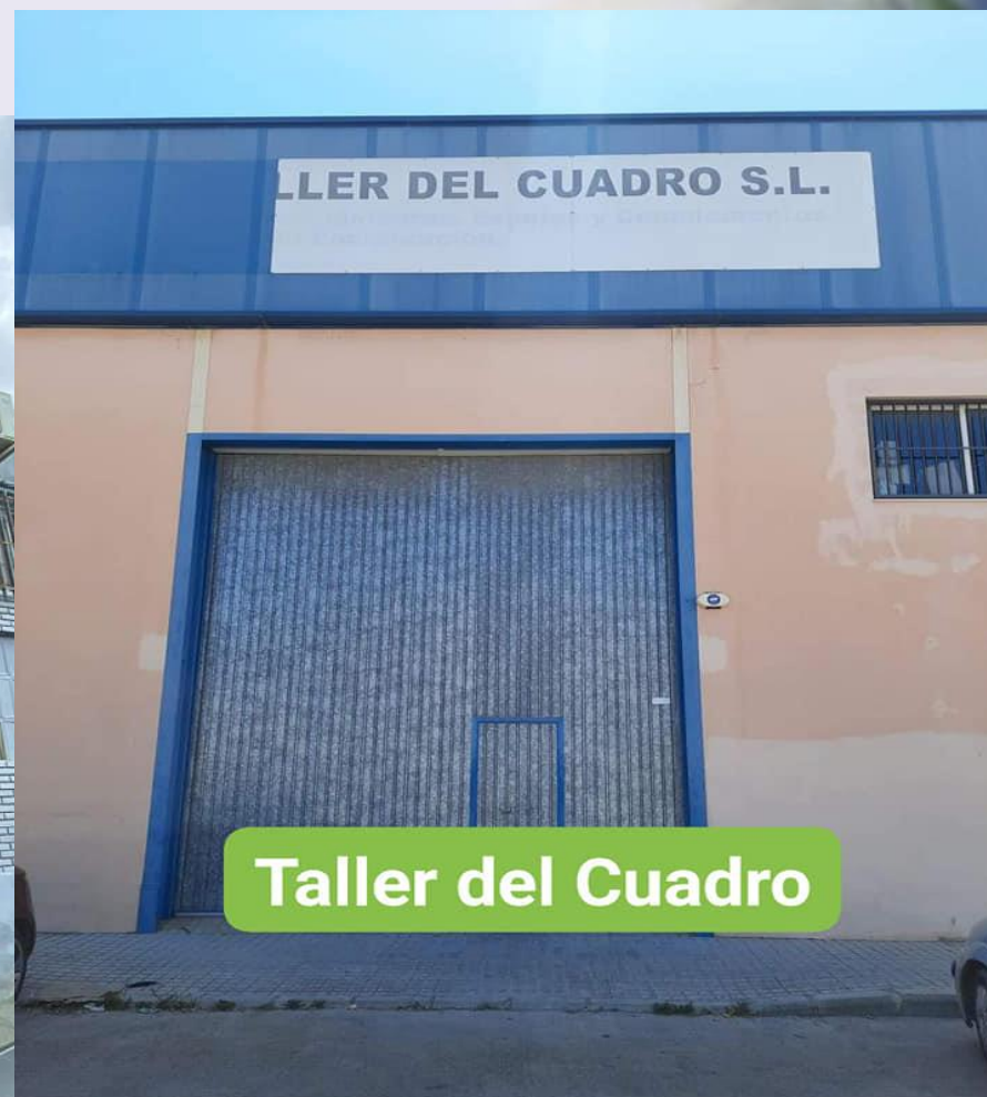
Taller del Cuadro